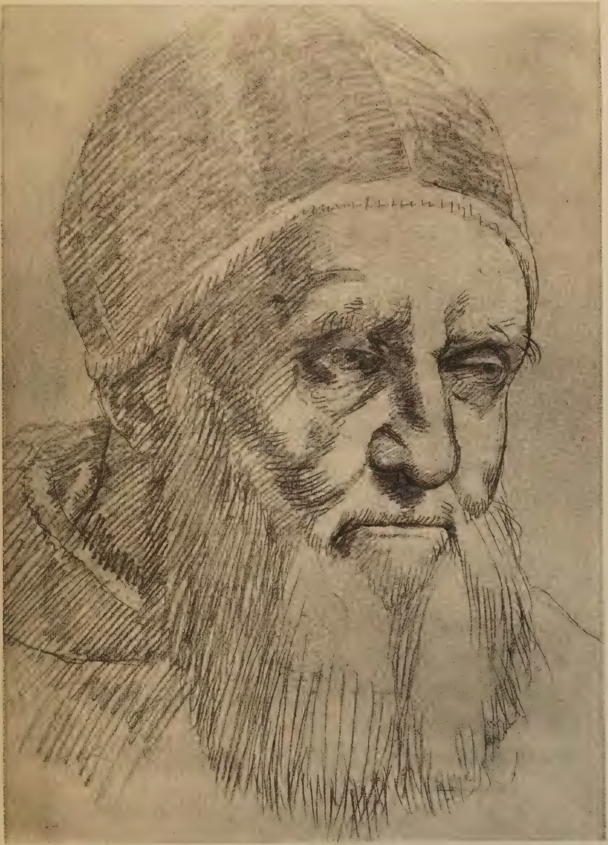
Etude pour le portrait du Pape Jules II